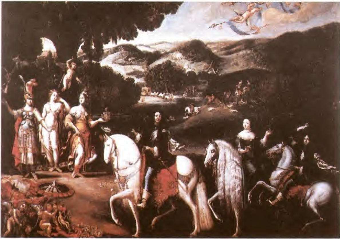
Alegoría de la boda de Luis XIV con la infanta María Teresa y de la Paz de los Pirineos, 1659

Todo el conjunto armonizado por un estilo común, cuya esencia se encuentra a menudo en los gustos y designios del propio Luis XIV. Allí se manifiesta su admiración por el arte italiano de la época, aunque con un matiz muy marcado de sobriedad, de regularidad, de majestad y grandeza un tanto envarada y fría. Para fomentar este gusto se creó, en 1666, la Academia Francesa de Roma, cuya función para permitir a los jóvenes artistas franceses ir a estudiar directamente los modelos de la Antigüedad y del Renacimiento, mientras que en París la Academia de Pintura y Escultura, bajo la dirección de Charles Lebrun, se encargaba de vigilar la observancia de las reglas del buen gusto, dictadas por el propio rey. La misma dictadura estética, la misma preceptiva clasicista triunfarían en la producción literaria, dirigida por la Academia Francesa de la Lengua.